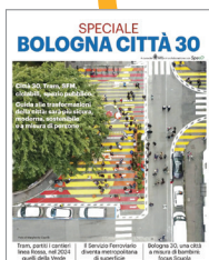
SPECIALE BOLOGNA CITTÀ 30