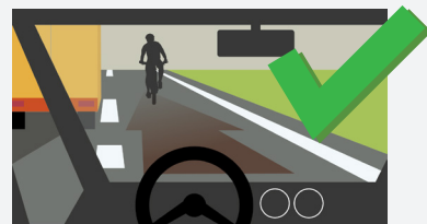
POSIÇÃO PARA DESENCORAJAR O CONDUTOR DO VEÍCULO